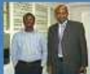
Responsable des Relations Extérieures du club à gauche avec le SGA -UNIDA à droite