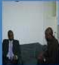
Le SGA-UNIDA en discussion avec le Président du club.