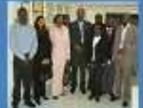
photo de famille au club OHADAT