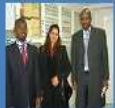
le SG du club, son Assistante et le SGA- UNIDA.

Rencontre organisée par la BAD le 08-04-2009 avec pour invités : Le CLUB OHADAT, Les étudiants et le Chef du département de droit de l'université libre de Tunis.