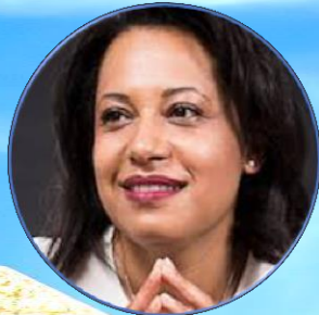
SALWA TOKO PRÉSIDENTE DU CONSEIL NATIONAL DU NUMÉRIQUE FRANÇAIS