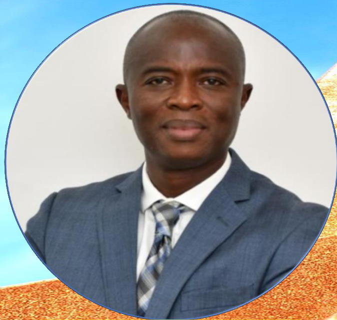
CHARLES TCHUENTE PRÉSIDENT DE L'ASSOCIATION CAMEROUNAISE DES AVOCATS D'AFFAIRES