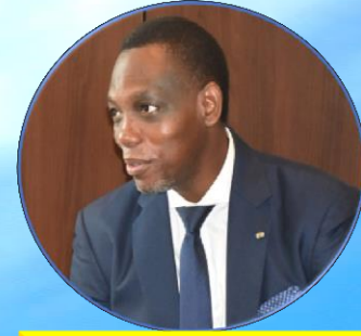
YVON DETCHENOU ANCIEN BÂTONNIER DE L'ORDRE DES AVOCATS DU BENIN