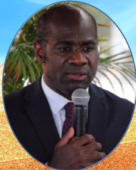
PIERRE DE GAÉTAN NJIKAM HOMME POLITIQUE PROMOTEUR DES NUMAF JOURNÉES NUMÉRIQUES BORDEAUX-AFRIQUE