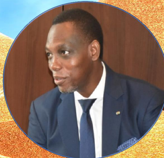
YVON DETCHENOU ANCIEN BÂTONNIER DE L'ORDRE DES AVOCATS DU BENIN