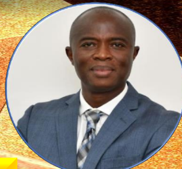
CHARLES TCHUNTE PRÉSIDENT DE L'ASSOCIATION CAMEROUNAISE DES AVOCATS D'AFFAIRES