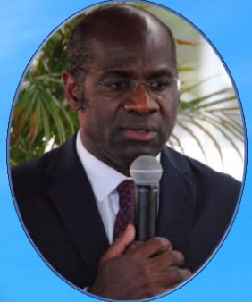
PIERRE DE GAÉTAN NJIKAM HOMME POLITIQUE PROMOTEUR DES NUMAF JOURNÉES NUMÉRIQUES BORDEAUX-AFRIQUE