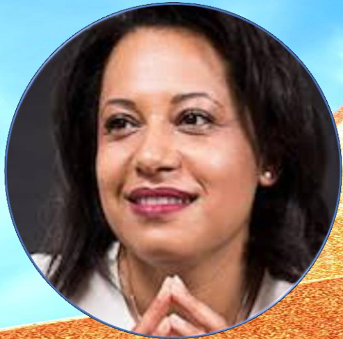
SALWA TOKO PRÉSIDENTE DU CONSEIL NATIONAL DU NUMÉRIQUE FRANÇAIS