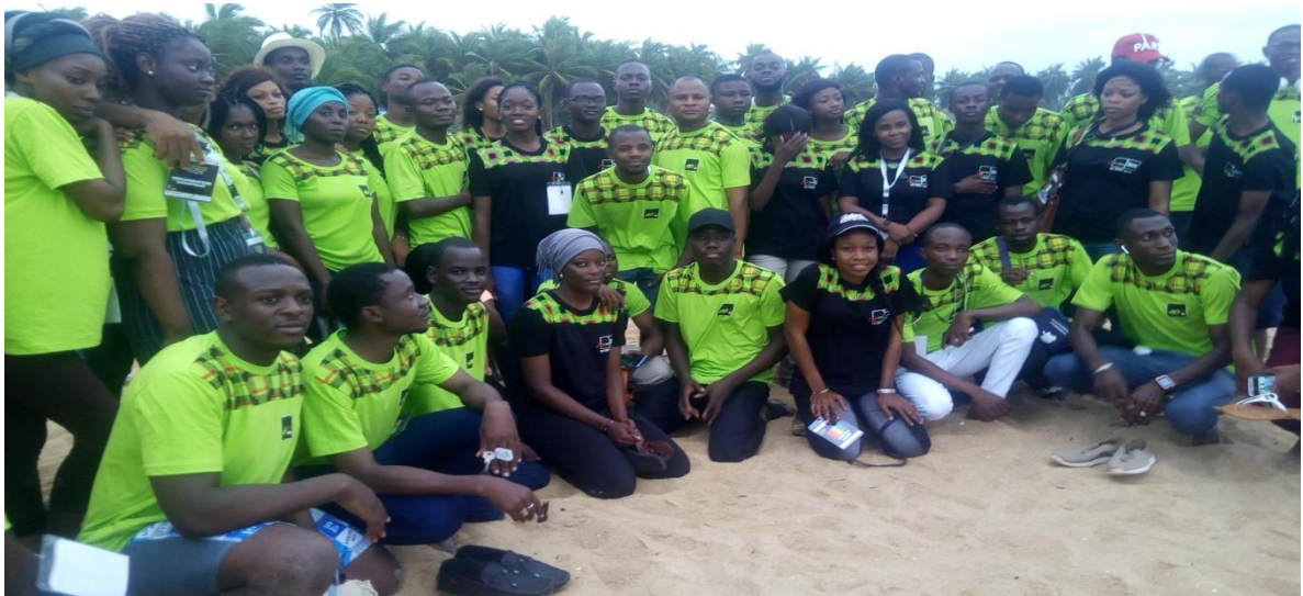
Les participants au CGHO 2019 lors de l'excursion du 11 septembre 2014 à la plage de Lomé