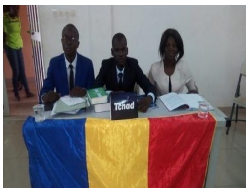
Après avoir livré son premier match contre le Mali, l'équipe tchadienne s'est mesurée au pays organisateur lors de sa deuxième et dernière rencontre de poule

L'équipe du Tchad, dans le rôle du défendeur, a livré son premier match de plaidoirie contre le Mali. Contre le pays organisateur, le Togo, en revanche, les Sao ont plaidé en demande.