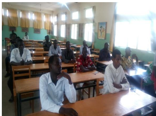
A gauche : Vue des candidats lors de la composition du test écrit au Centre Catholique de N'Djaména

A Moundou, la composition des épreuves a eu lieu dans l'enceinte de l'Université, sous la supervision du chef de département de Droit de ladite université.