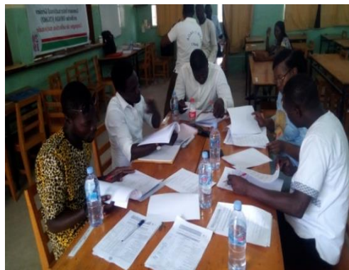
Adroite : Les membres du jury en pleine délibération

Durant une heure et trente minutes, les candidats ont été soumis à un questionnaire portant sur la culture générale, l'intégration africaine, et le droit OHADA. A l'issue des délibérations ayant suivi séance tenante la composition, 12 candidats dont deux filles ont été déclarés admissibles à passer les épreuves orales qui se sont déroulées une semaine plus tard.