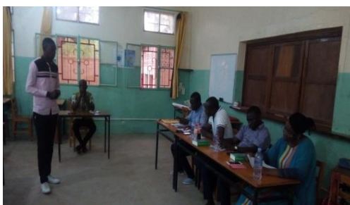
Un candidat t devant le jury lors des épreuves orales