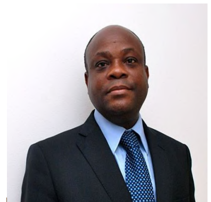
PRIX MADIBA DE L'EXCELLENCE AFRICAINNE 2019

De nationalité béninoise, Avocat et Professeur d'Université, il est diplômé de l'Université Nationale du Bénin et du Canada. Il a été Ministre de l'enseignement supérieur et de la recherche scientifique (2001-2003), Garde des sceaux, Ministre de la justice, de la législation et des droits de l'homme (2003-2006), plusieurs fois Ministre intérimaire des Affaires Etrangères (cumulativement, entre 2003 et 2006). Depuis le 31 mars 2011, il est Secrétaire Permanent de l'OHADA. Sous son impulsion et son dynamisme, le droit OHADA aura connu la révision du Traité OHADA, la modernisation des Actes Uniformes, la numérisation du Registre de commerce, l'adhésion de nouveaux pays, l'ouverture de l'OHADA à l'international et une attractivité sans précédent. Bravo et Merci !