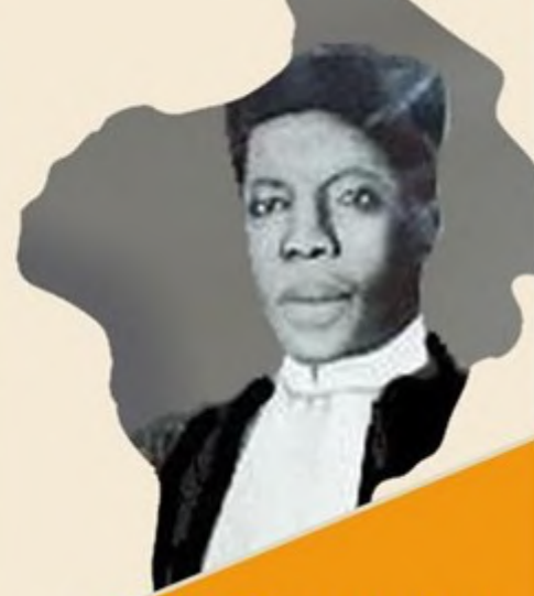
OUANILO GBEHANZIN Prince du Danhomey Premier Avocat noir africain d'origine béninoise ayant fait ses études de droit à l'Université de Bordeaux