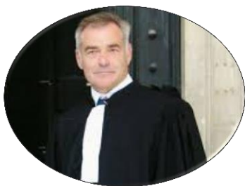
M. Jérôme DIROU Bâtonnier de l'Ordre des Avocats de Bordeaux